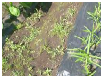
畑 (マルチ / 作物の周り)